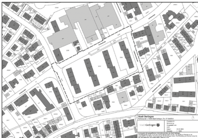
Abbildung 1: Geltungsbereich des Bebauungsplans

Das Plangebiet umfasst die Flurstücke Nr. 110 (teilweise), 133, 134, 2007, 2008, 2009, 2010 sowie Teile der Flurstücke 2015 und 2246 der Gemarkung Gerlingen. Das Quartier Hofwiesen-/ Schillerstraße/ Wettgraben/ Kupferwiesenstraße liegt im Nord-Osten des Siedlungsgebietes der Stadt Gerlingen. Es grenzt im Norden an ein Gewerbegebiet, im Westen an ein Wohngebiet und im Süden und Osten an Gemengelage mit Wohn- und Gewerbenutzungen.