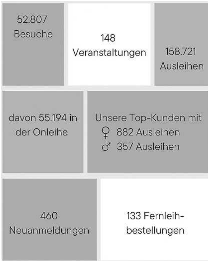
Plakat: (c) Henkel/Canva