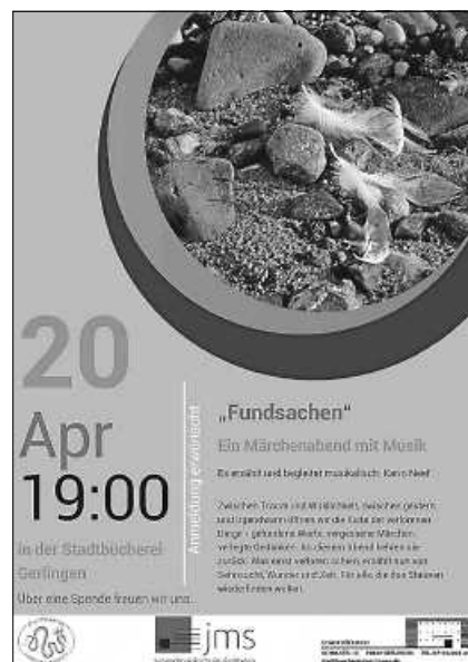
Plakat: (c) O. Liegl

Zwischen Traum und Wirklichkeit, zwischen gestern und irgendwann öffnen wir die Kiste der verlorenen Dinge – gefundene Worte, vergessene Märchen, verlegte Gedanken. An diesem Abend kehren sie zurück. Was einst verloren schien, erzählt nun von Sehnsucht, Wunder und Zeit. Für alle, die das Staunen wiederfinden wollen.