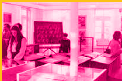
Erste Sonderausstellung im Alten Schulhaus

Im Zentrum unserer Jubiläumsschau steht ein Rückblick auf die Ausstellungen der letzten 65 Jahre. Plakate, Postkarten, Zeitungsartikel und ausgewählte Ausstellungsobjekte wecken Erinnerungen, bieten aber auch viele überraschende Entdeckungen. Vielleicht inspiriert Sie das auch zu eigenen Ausstellungsideen. Wie soll es weitergehen? Gerne kommen wir mit Ihnen ins Gespräch.