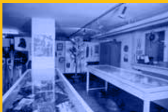
Ungarndeutsches Museum im Neuen Rathaus