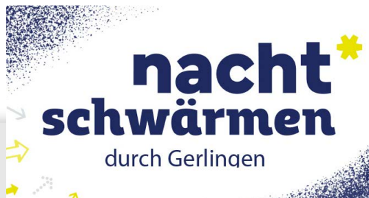
Nachtschwärmen durch Gerlingen