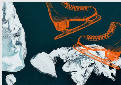
Gerlingen Auf Eis