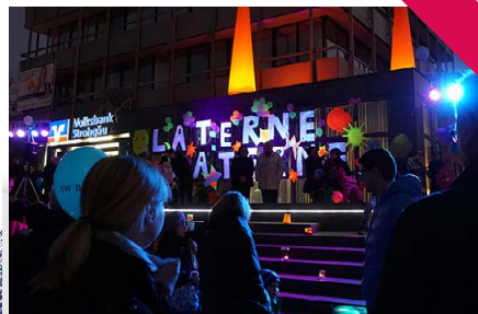
Lange Einkaufs- und Kulturnacht