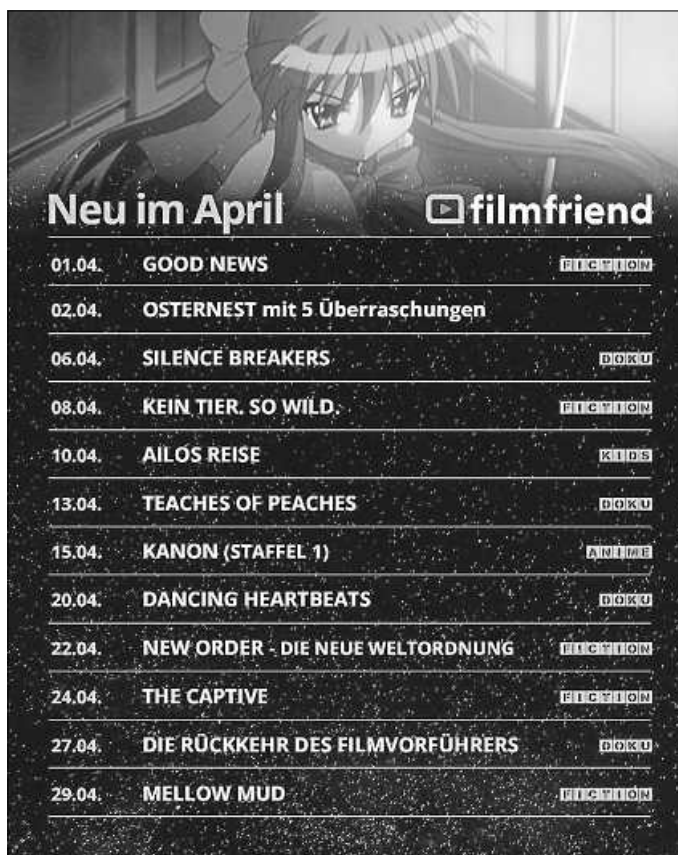
Plakat: (c) filmfriend

Pünktlich zum Osterfest hält die Stadtbücherei Gerlingen ein besonderes Highlight für alle Filmfans bereit: Entdecken Sie fünf exklusive Film-Überraschungen im digitalen „Osternest“ von filmfriend und freuen Sie sich auf zwei Spielfilme, eine Serie, einen Dokumentarfilm und eine Animationsserie für Kinder. Zusätzlich ziehen im April wie gewohnt viele weitere Neustarts aus den Bereichen Arthouse-Kino, Dokumentation und Kinderprogramm in das Streaming-Portal ein.