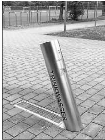
Trinkwasserbrunnen am Breitwiesenstadion