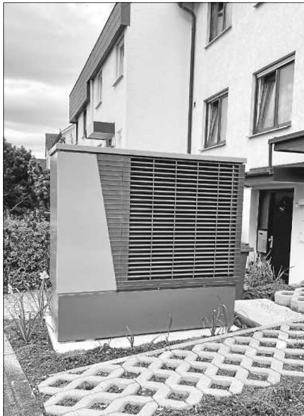
Damit die Wärmepumpe rund läuft, gibt es ab jetzt Unterstützung bei der Auswahl Ihrer Angebote

Wer eine Wärmepumpe einbauen möchte, holt sich oft mehrere Angebote ein und steht vor der großen Frage: „ Welches Angebot ist wirklich gut? “ Ein vollständiges Angebot ist für eine gut funktionierende Wärmepumpe unerlässlich, da sie sorgfältig geplant und fachgerecht eingebaut werden muss. Darum sollten auch Aspekte wie eine Heizlastberechnung, hydraulischer Abgleich, der Tausch einzelner Heizkörper oder die Entsorgung der alten Heizung enthalten sein. Viele Hausbesitzer fühlen sich von den seitenlangen, technisch formulierten Angeboten überfordert. Beim neuen Beratungsangebot bewerten Energieberatende die eingereichten Angebote vorab, prüfen auf Vollständigkeit und erklären die Ergebnisse in einer persönlichen Videoberatung.