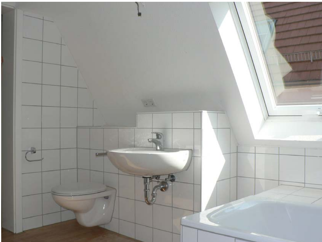
Badezimmer – Waschbecken und Toilette