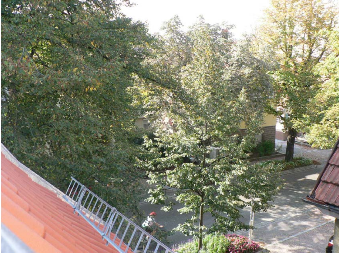
Ausblick aus Dachflächenfenster