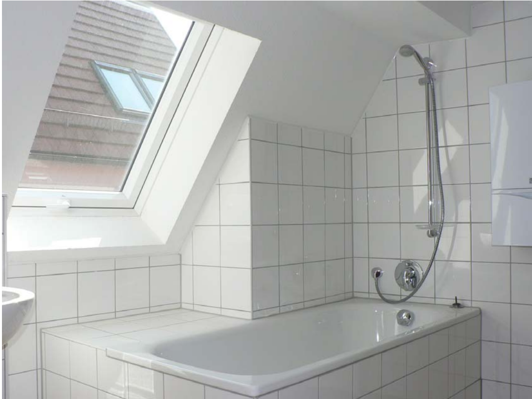
Badezimmer – Wanne