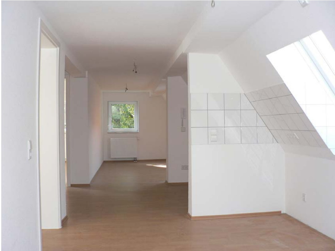
Blick vom Kochen in den Wohnbereich