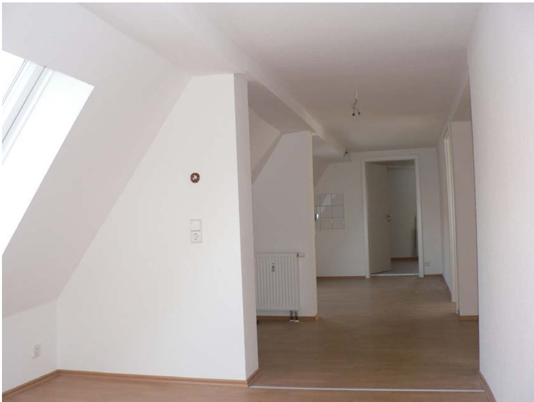
Blick vom Wohnbereich über Essen und Kochen zur Schlafzimmereingangstür