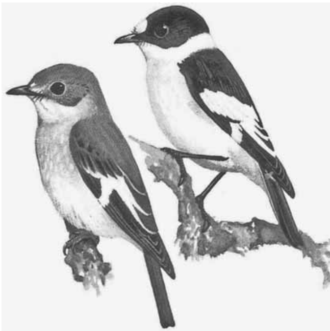
Halsbandschnäpper Ficedula albicollis : links Weibchen, rechts Männchen

Jede und jeder Vogelfreund, der einen Halsbandschnäpper beobachtet, wird darum gebeten, dies zu melden an Maarten van den Akker, Telefon 07156 270856 oder Email Maarten.vandenakker@web.de . Fragen zur Arbeit des NABU Gerlingen können an Günter Vaasen, Telefon 07156 434332 gerichtet werden.